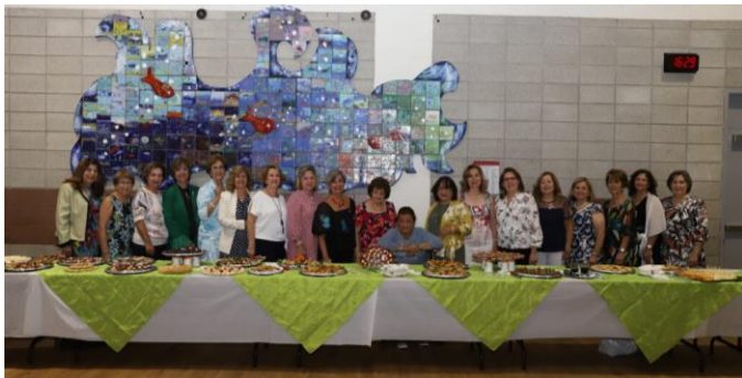
Merci à une merveilleuse équipe