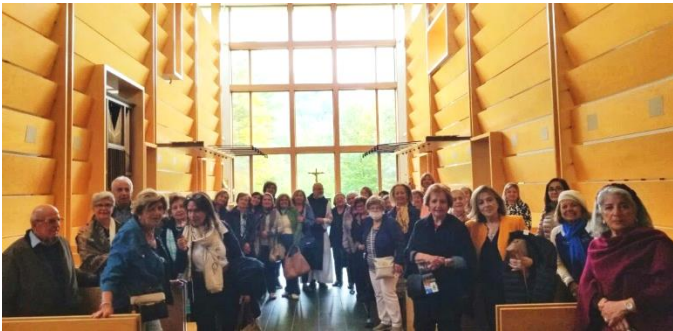
Dans la chapelle

Par une belle journée d'automne, le 21 septembre notre autobus s'en allait vers la région de Joliette, sous un ciel couvert mais avec une température encore agréable.