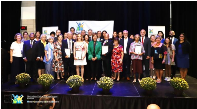
Les 5 Gouverneurs, les 3 boursiers entourés des membres du conseil et des dignitaires invités

Travailleuse infatigable, elle accueille les nouveaux arrivants, les aide à se loger, se trouver des meubles, se procurer des denrées au comptoir alimentaire, trouver une école pour les enfants ou les inscrire à des cours de francisation. Tout cela dans la joie et l'espérance.