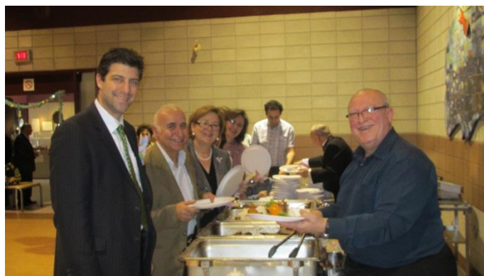
Le buffet était bon!

Nous avons aussi une troupe de jeunes danseurs québécois qui a exécuté des danses folkloriques québécoises et des danses indiennes 'Bollywood'.