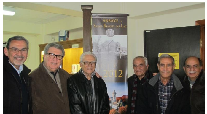
Nous sommes passés par la boutique de l'abbaye acheter cidre et fromages

C'est là que nous avons chanté ensemble et fait jouer les chants religieux de Fairouz de la Semaine Sainte : 'Ya om allah, al ayoun ollika 'ala khachaba'. C'était de toute beauté.