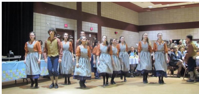
Une danse québécoise

La Fête du Printemps nous a réunis cette année par un temps clément à la mi-mars. Pendant que sur la Sainte-Catherine s'excitait la fanfare pour la St-Patrick nous avons innové cette année en réunissant tous les porteurs du nom de Joseph et leur avons chanté l'hymne jadis très populaire