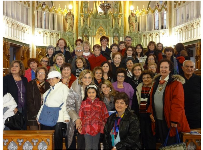
Notre groupe dans la belle église St-Patrice

Quels beaux chants et quel recueillement. Nous étions sur le point d'envier ces religieux qui consacrent leur vie au chant et à la prière. En fait de nos jours ils ne vont plus dans les champs, mais engagent des gens pour cultiver, faire leur fromage réputé et leur cidre. Eux ils étudient ou donnent des cours ou accompagnent des pèlerins dans leur retraite.