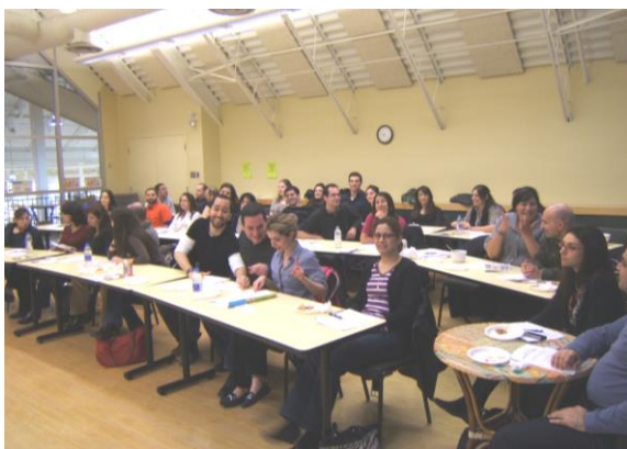
Les jeunes professionnels au cours de cuisine

Le 7 avril a eu lieu le tout premier cours de cuisine offert aux jeunes de l'Entraide. Tenu à l'atelier communautaire de Loblaw's, cette introduction à la cuisine a expliqué au groupe de 35 jeunes réunis les secrets d'un bon risotto aux champignons sauvages, ainsi que la recette du mi-cuit au chocolat noir.