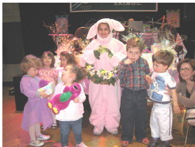
Lapinot entouré de joyeux enfants