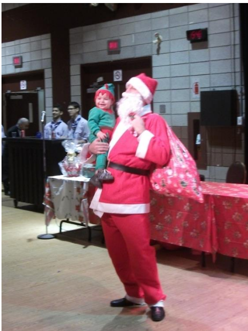
Père Noël et son lutin bébé-Nicolas

Une vraie fête familiale qui nous introduit aux festivités de Noël. Parents et grands-parents accompagnaient leurs enfants, entouraient le clown Zooé qui leur racontait des histoires et leur faisait des jeux pendant que d'autres enfants se faisaient maquiller le visage. La Fanfare des Cadets de la Dauversière formée d'une vingtaine de jeunes de 12 à 18 ans faisait son entrée avec tambour et trompette, jouait ensuite des mélodies de Noël. Une belle table de douceurs avec Bélila/Amhha traditionnelle était offerte par les Dames. Tout cela en l'honneur de la Sainte-Barbe, jeune sainte et martyre du 2 e siècle, du nord de la Syrie.