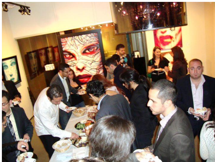
Les jeunes autour de la table des fromages

Le 5 à 7 a eu lieu au Mint Lounge à Laval le 27 octobre. Une soixantaine de jeunes professionnels se sont réunis pour faire de nouvelles connaissances, se retrouver entre amis et faire du réseautage.