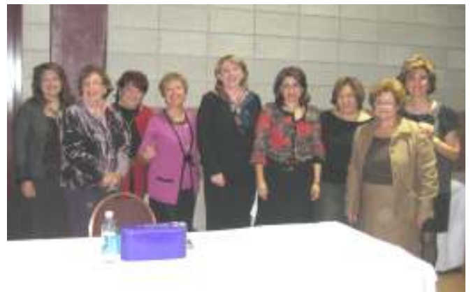
Mme la ministre Christine St-Pierre entourée par les bénévoles.

Sainte Barbe est commémorée chaque année par l'Entraide. Encore une fois cette année nous avons fêté ensemble cette journée dédiée à une martyre de l'église orientale. Nous avons chanté Addissa Borbara et dégusté la Bélila/ sli-ka/ ameh, préparé par nos Dames. Une belle occasion pour réunir toute la famille, des grands parents aux petits enfants. Le Père Noël aussi a fait un petit tour au grand plaisir des enfants qui ont tous reçus de lui des petits cadeaux.