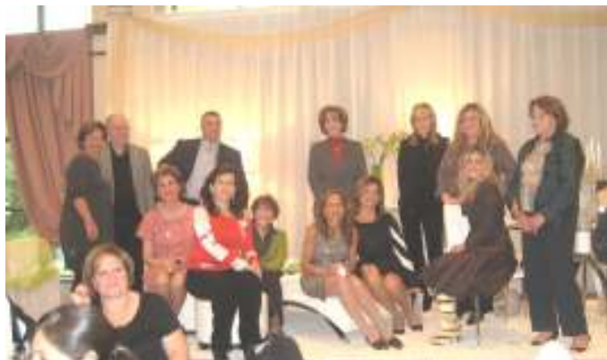
Les heureuses gagnantes de la tombola

Merci au Comité des Dames pour le beau succès du déjeuner-causerie du 8 octobre « Passez au Salon » en collaboration avec Maison Corbeil.