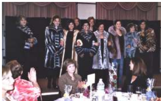
Nos mannequins d'un jour en fourrure

Convoitise de la beauté féminine et avant-goût de l'hiver.