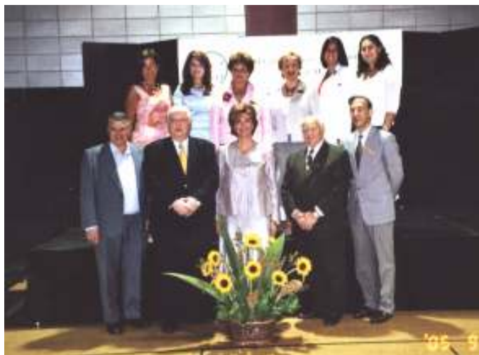
Sur notre photo, le conseil d'administration de l'Entraide 2005-2006 élu à notre dernière assemblée générale