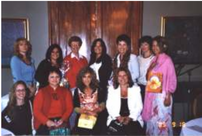
Sur la photo, les gagnantes du tirage qui a suivi la conférence tenue sur le site enchanteur du Manoir Rowville-Campbell.

En quelques mots ce n'est pas tout de connaître du monde. Il faut personnaliser sa relation, offrir une crédibilité et inviter la confiance, être utile et rester sur le plan positif. Vital d'être bien informé. Il faut créer une relation d'abord, payer d'avance; avant de demander une faveur et le retour de l'ascenseur. Finalement il faut savoir reconnaître et remercier.