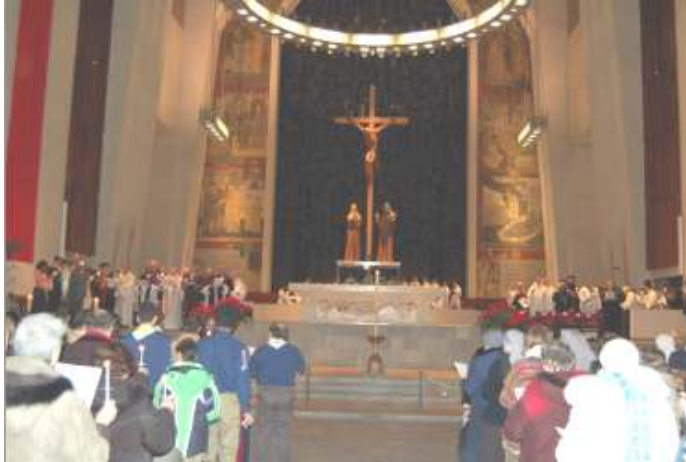
Les membres du clergé debout des deux côtés de l'autel faisaient face à la foule

A l'occasion de la clôture de la semaine de prières pour l'unité chrétienne, le Rassemblement des chrétiens du Moyen-Orient a organisé – avec d'autres organismes du Grand-Montréal – la soirée de Retrouvailles chrétiennes, le dimanche soir 28 janvier dernier à l'Oratoire St-Joseph du Mont-Royal.