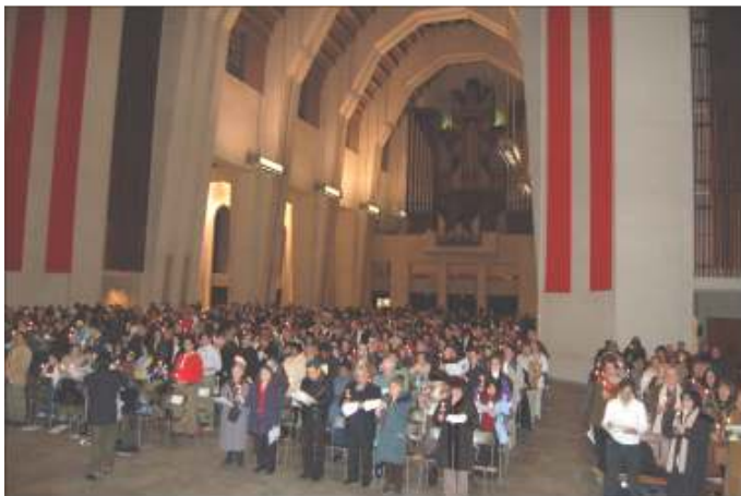
Tous les assistants récitaient le même credo

Il y avait près de mille personnes : catholiques, orthodoxes, protestants. La cérémonie a été radio-diffusée en direct sur Radio Ville-Marie 91.3 FM et ceci lui a donné un rayonnement plus grand.